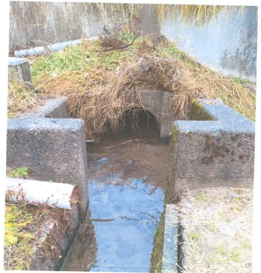
暗渠内に土砂が堆積しているため、呑口柵内 にも土砂が堆積している