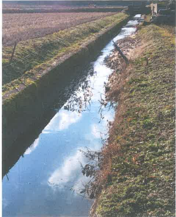
下流から(溝畔修繕前)