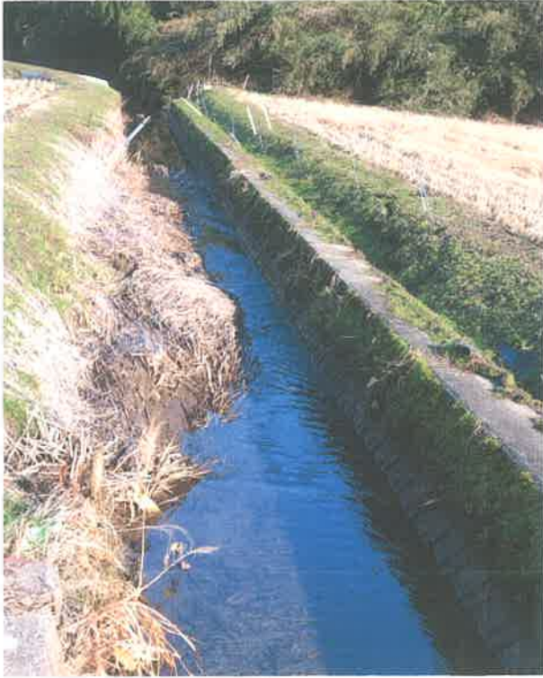
上流から(溝畔修繕前)