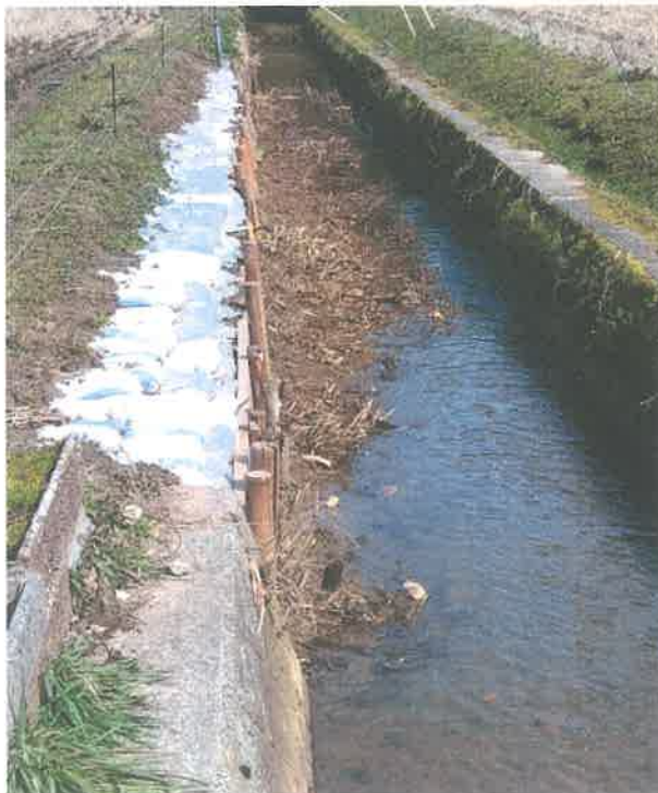
上流から(溝畔修繕後)